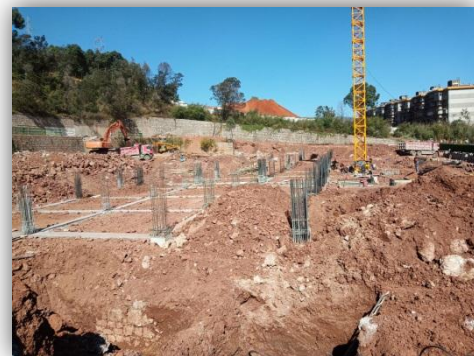
报告厅及音体馆施工进度情况