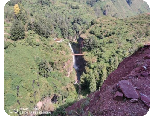
引水管线经过位置山高箐深，管材搬运十分困难