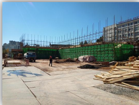
2#教学楼施工进度情况

经各参建单位积极配合，截止 2020 年 11 月 15 日，2#、3#教学楼基础及±0.000 层已施工完成，正在进行±0.000~3.900 层梁板柱模板、钢筋安装；报告厅及音体馆桩基已全部施工完成，正在进行承台施工，独立基础完成全部工程量的 50% 左右；挡土墙及支护桩施工已完成全部工程量的 80% 左右。【卢加建】