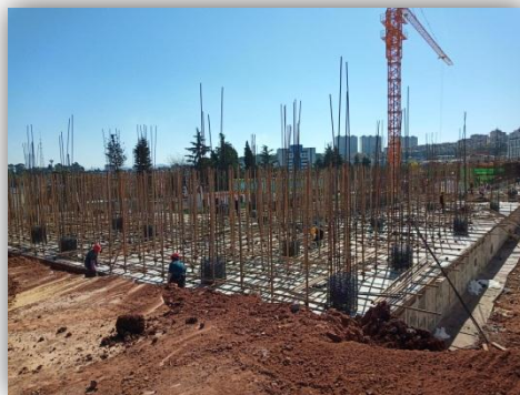
3#教学楼施工进度情况